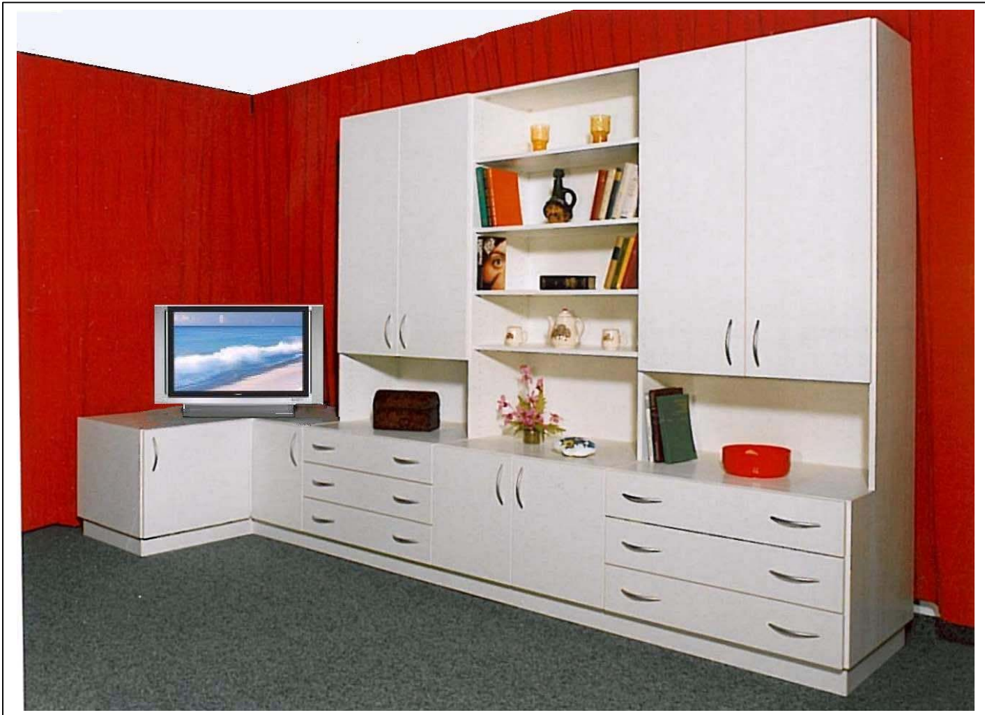
Bild in Esche Struktur weiss.

Masse: Höhe 205cm Tiefe 40/60cm Totale Breite 100cm + 82cm + 80cm + 80cm = 342cm